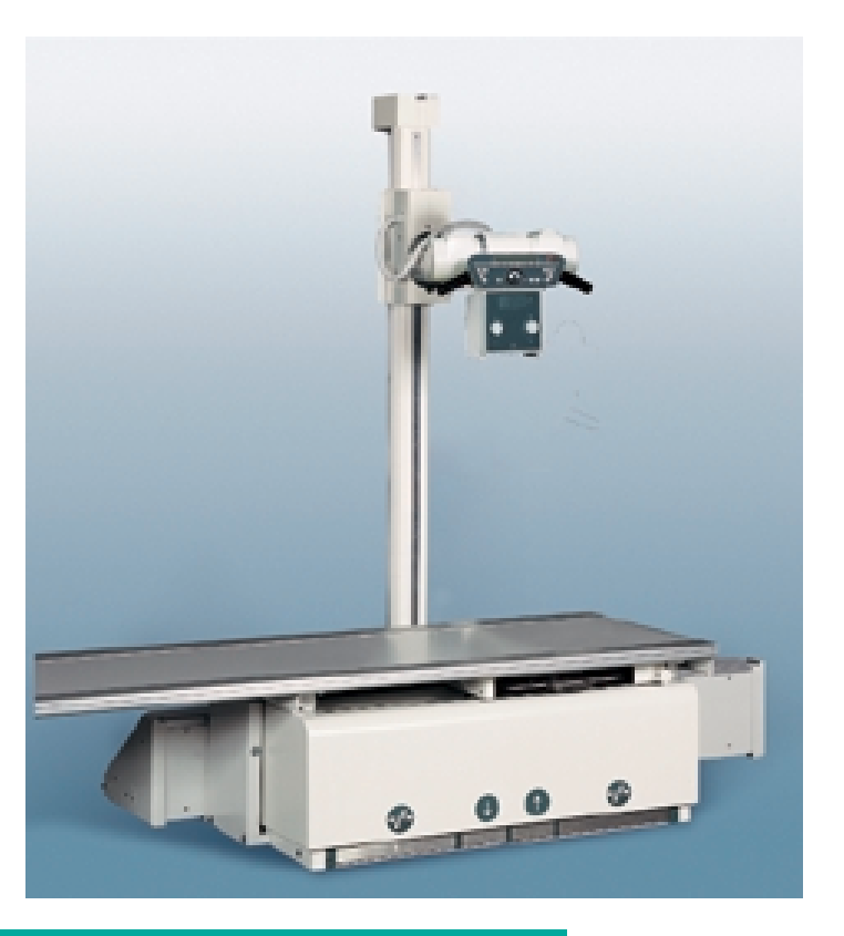
Table Bucky réglable en hauteur avec support de tube rotatif avec mouvement longitudinal.

Combinaison avec des suspensions de tubes et de plafonds pour procédures radiographiques spécialisées et de routine.